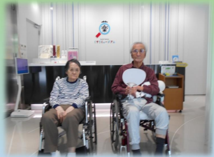
場所は日本橋 第一三共株式会社ビル内にあります