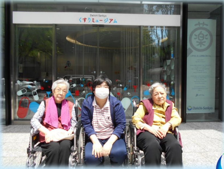
くすりミュージアム前にて

くすりミュージアムに行きました。 いつもお世話になっている薬のこ とだけに、大変勉強になりました。